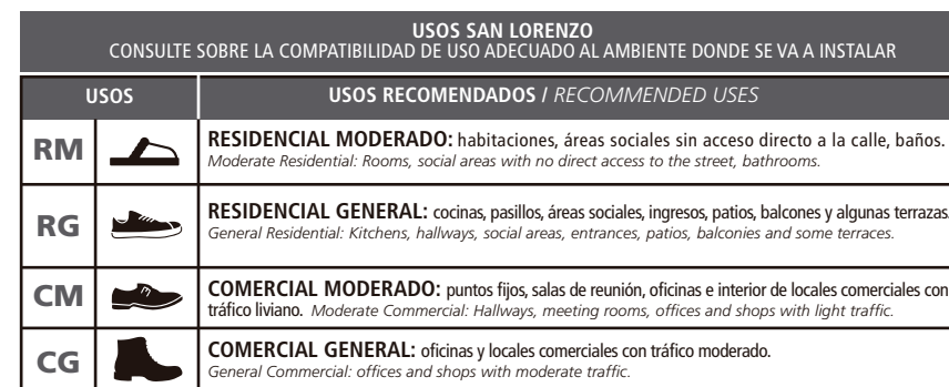
TABLA DE USOS