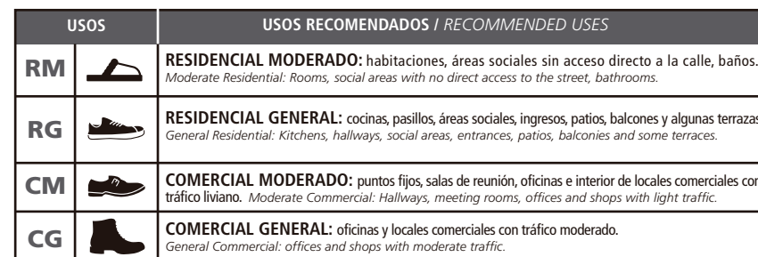
TABLA DE USOS