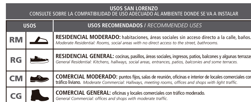
TABLA DE USOS