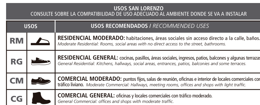
TABLA DE USOS