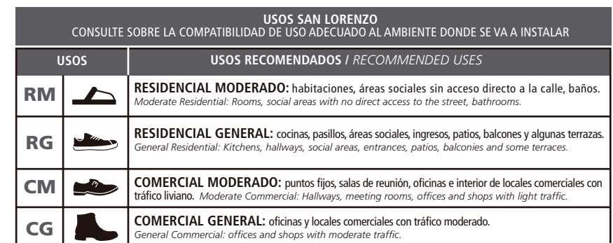
TABLA DE USOS